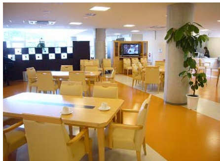
広々としたダイニング

「レストヴィラ座間谷戸山公園」は、地上3階建て、居室総数99室、丹沢山系を望む小高い丘に建つスタイリッシュな邸（ヴィラ）です。ホーム内には、全面ガラス貼りで吹き抜けのあるエントランスロビーや、開放感あふれるビューラウンジ、陽だまりのなかでくつろげるサンデッキなど、光や風を存分に取り入れる工夫がなされ、心地よい開放感にあふれています。また、広々としたダイニング、カフェコーナー、理美容室などの共用スペースを充実させ、お一人ずつゆったりとした気分に入れるヒノキ風呂など、“わが家”のような癒しの空間のなか快適で豊かな日々をお過ごしいただけます。