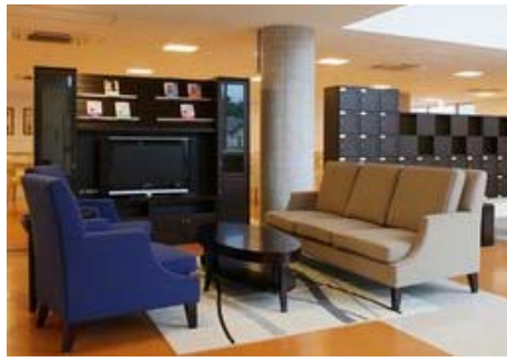
本格的なエスプレッソマシンを備えたカフェ