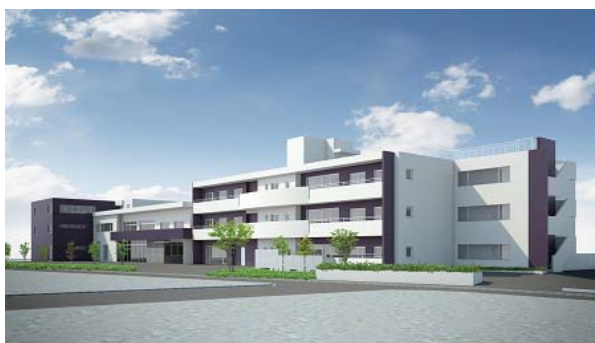
レストヴィラ座間谷戸山公園（建物：賃借）

⇒ http://home.wataminokaigo.net/search/home/zamayatoyama/index.html